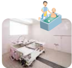
5 機械浴室 (介護度の高い方用)