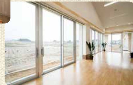
10 リビングA(サービス付高齢者向け住宅) 四季折々の花、お米の収穫、鳥海山の新緑や紅葉、雪景色など1年中お楽しみいただけます。