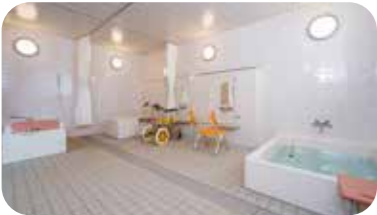
4 大浴場 (施設には4つの浴場がございます)