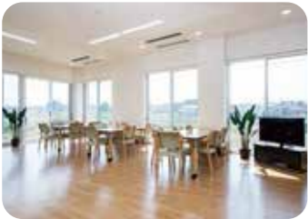
2 ダイニング兼機能訓練室 (複合型サービス)