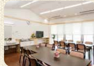
9 ダイニング (サービス付高齢者向け住宅)