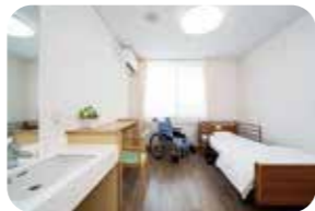
6 個室(複合型サービス)