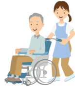
1 多目的ルーム 「キートス広場」